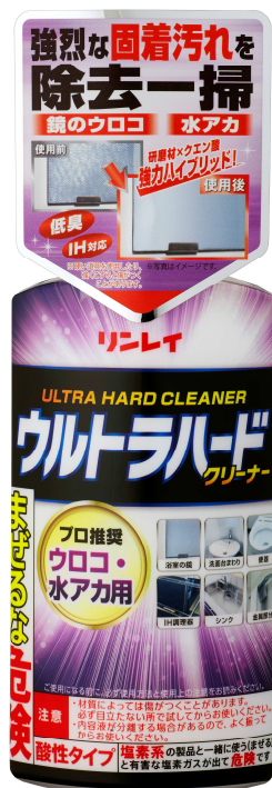
ウルトラハードクリーナー ウロコ・水アカ用

株式会社リンレイ（所在地：東京都中央区、代表取締役社長：鈴木 信也）は、住居用強力洗剤ウルトラハードクリーナーシリーズの第3弾「ウルトラハードクリーナー ウロコ・水アカ用」を、全国のホームセンターやドラッグストア、スーパー、公式直販サイト（ http://www.rinrei-wax.jp/ ）などで2017年9月1日(金)に発売いたします。