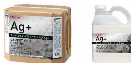
カーペットパイルコーティング Ag+ 18L RECOBO / 4L