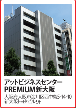
アットビジネスセンター PREMIUM新大阪 大阪府大阪市淀川区西中島5-14-10 新大阪トヨタビル9F

【会場】アットビジネスセンターPREMIUM新大阪 大阪府大阪市淀川区西中島5-14-10 新大阪トヨタビル9F