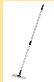
フラッシュモップ・ミニ