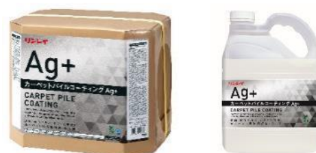
カーペットパイルコーティング Ag+ 18L RECOBO / 4L